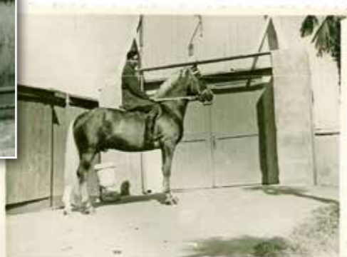
S Cirkusem Praha v tehdejším Sovětském svazu, Soči, 1967.