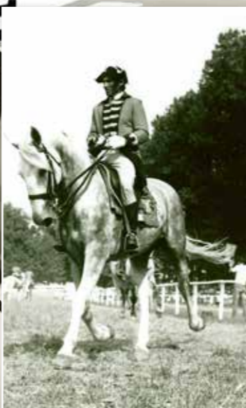
Čtverylka na Jezdecký den v Kladruzech n. L.