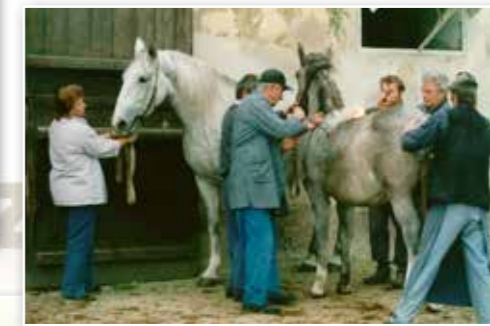
Pálení hřibat v Kladruzech n.L.