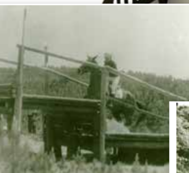
Military v Polsku, klisna Forma.