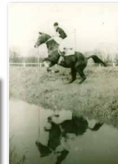
Military v Kladrubech n. L., 1968, při steplechase, hřebec Val.