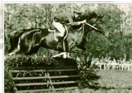
1958, Kladruby n. L., Jezdecký den, první parkur.