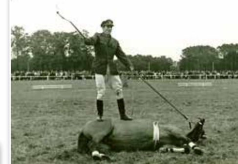
Ukázka „poslušnosti“ na Jezdecký den v Kladrubech n.L., 1968, klisna 863 Alarm.