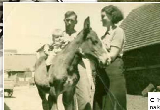
1942, Zvíkovec, poprvé na koni doma na statku.