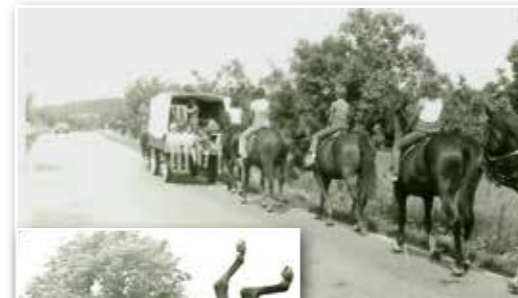
Jako vedoucí putovního tábora s koňmi.