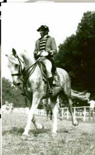
Čtverylka na Jezdecký den v Kladrubech n. L.