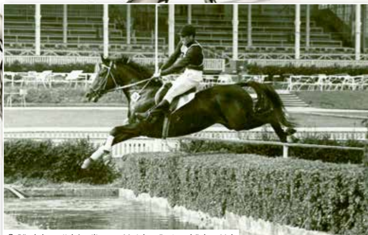
Předolympijské military v Mnichově 1971, hřebec Val.