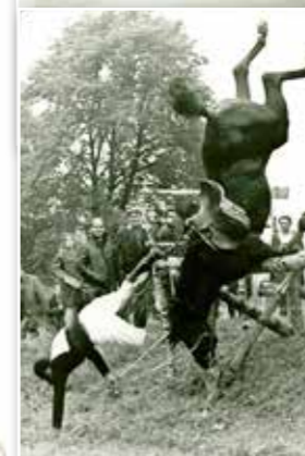
Mistrovství ČSR v military v Kladrubech n.L., 1971, hřebec Val, pád v krosu, nakonec 6. místo.