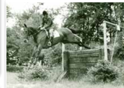
Military v Heřmanově Městci, klisna Forma.