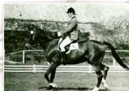
Military ve Varšavě, 1979, kůň Šanson, 11. místo, 1. místo v družstvech.