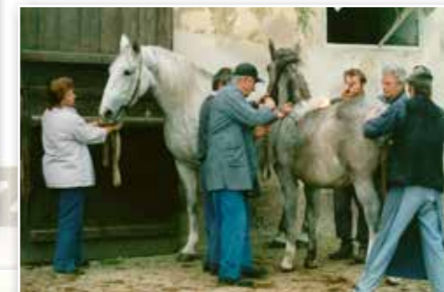
Pálení hřibát v Kladrubech n.L.